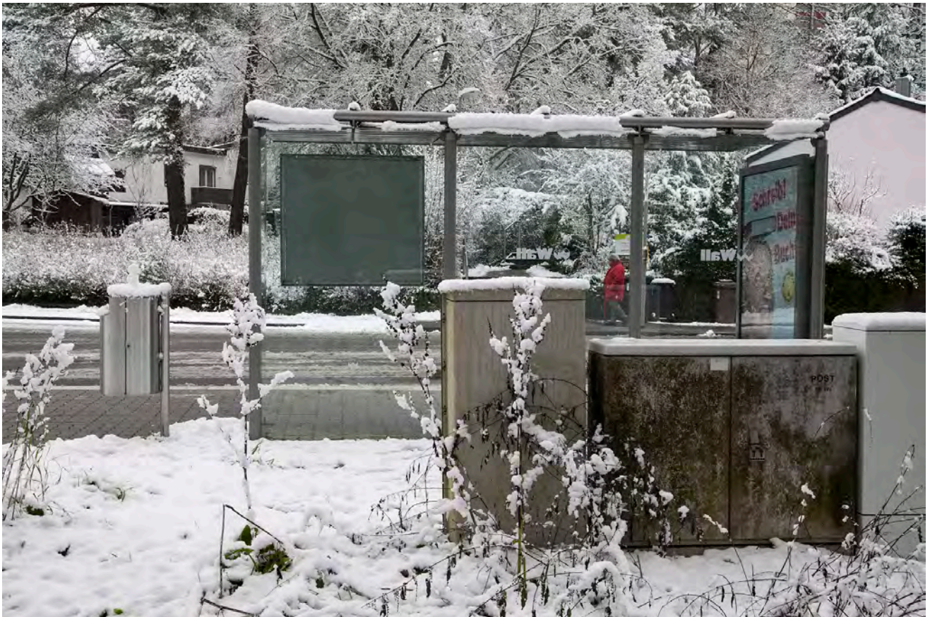
Aux Sources – Kaiserslautern, Allemagne, 2015-2018