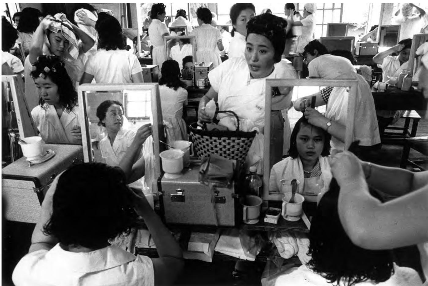
© William Klein Hairdressing school, Tokyo, 1961