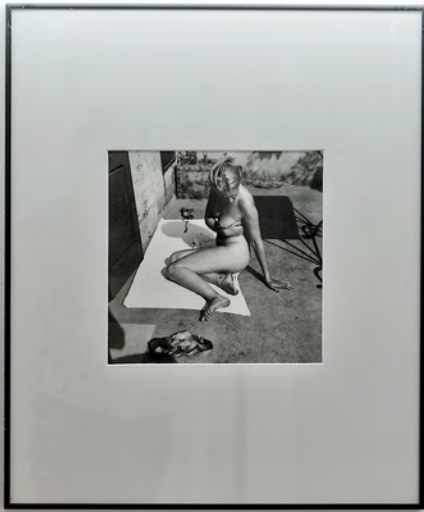
1940s-1950s Miami, Florida