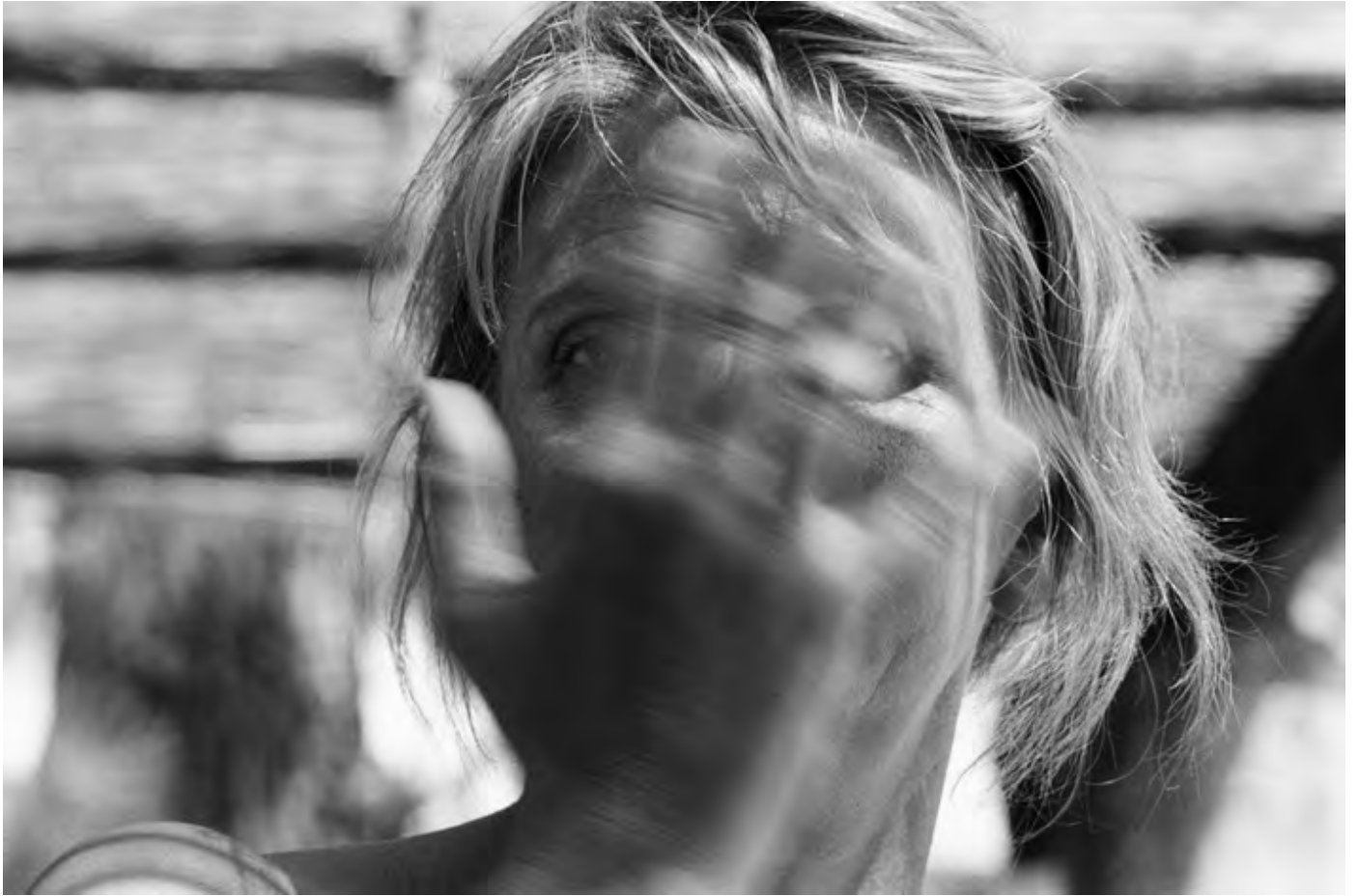
© Denis Roche 3 août 1993, Nice