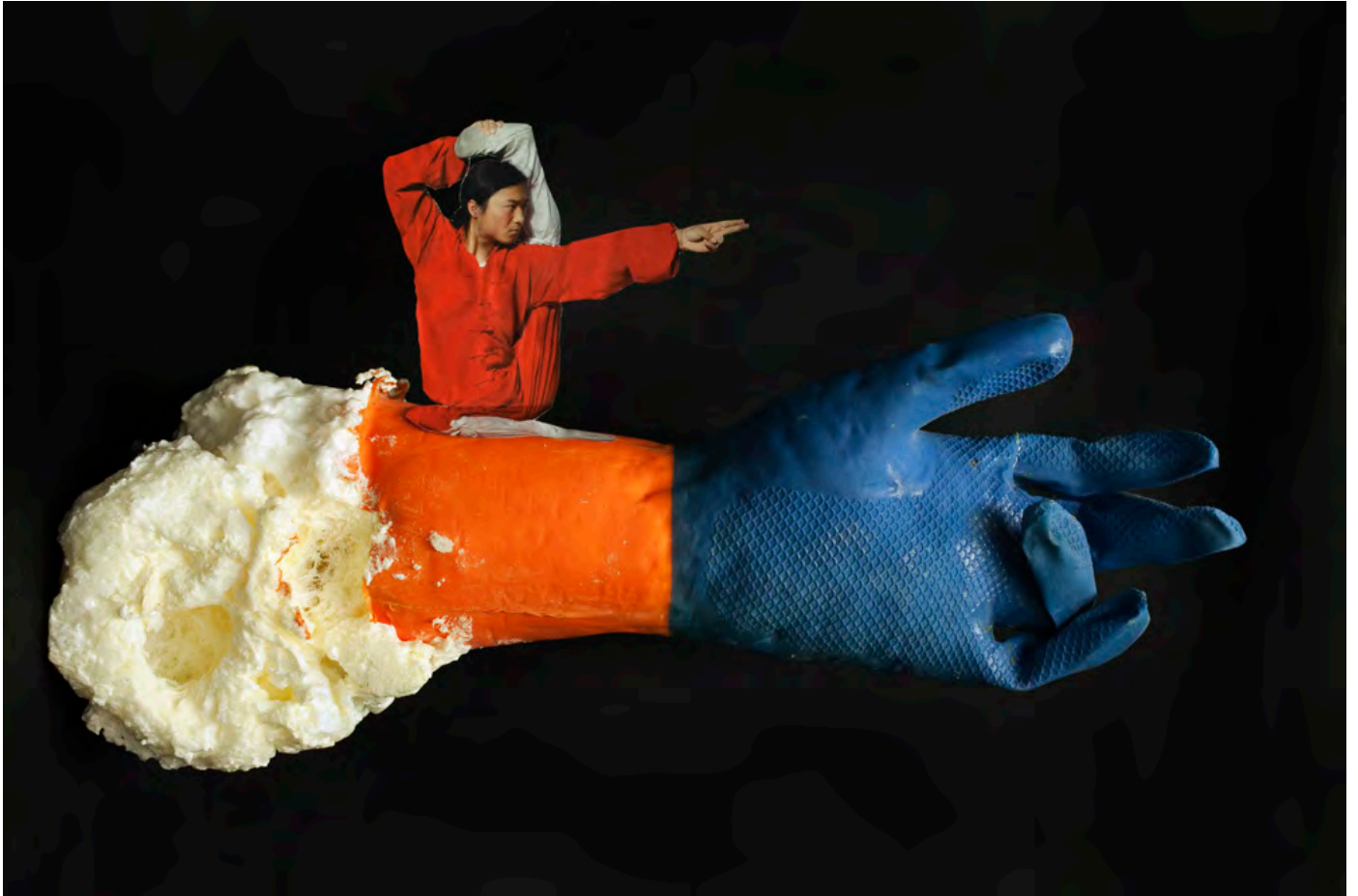
© Philippe Pétremant Fatal Combo , 2017