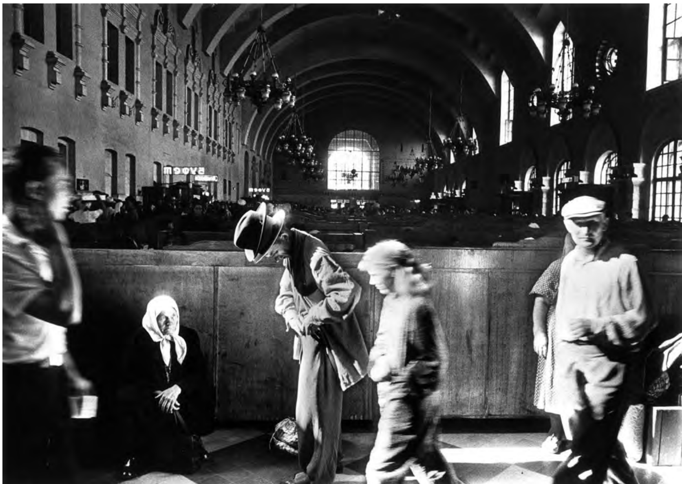
© William Klein Gare de Kiev, Moscou, 1959