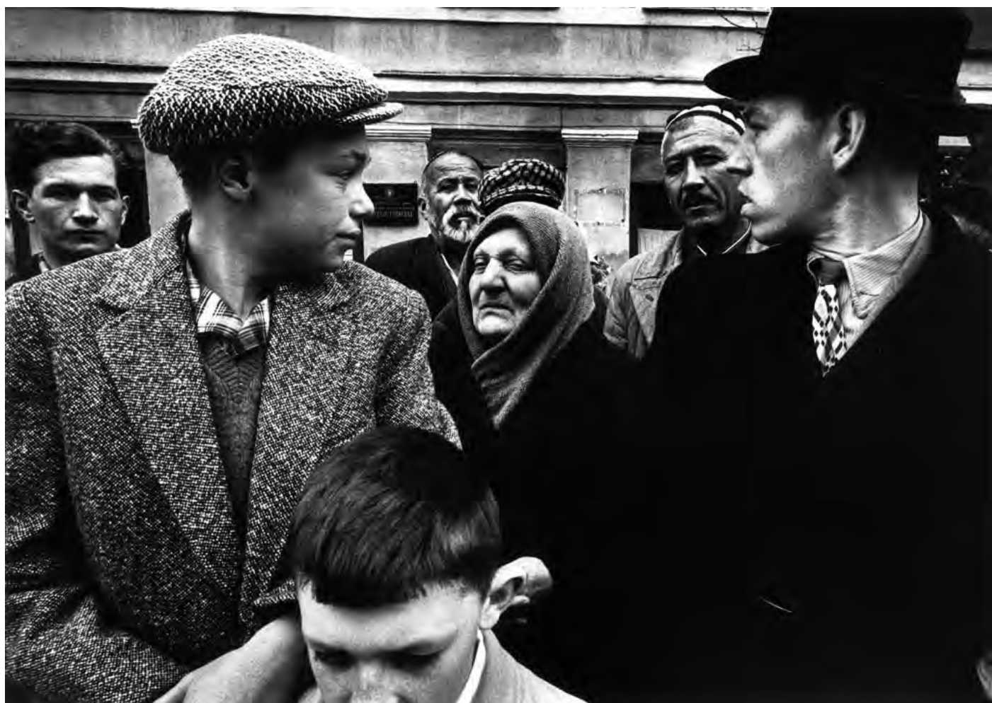
Spectateurs, défilé 1 er mai 1961, Moscou