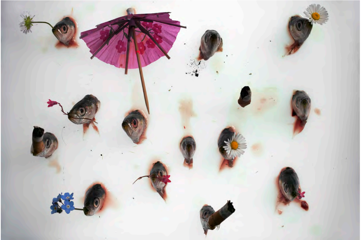
© Philippe Pétremant Tofu friendly , 2017