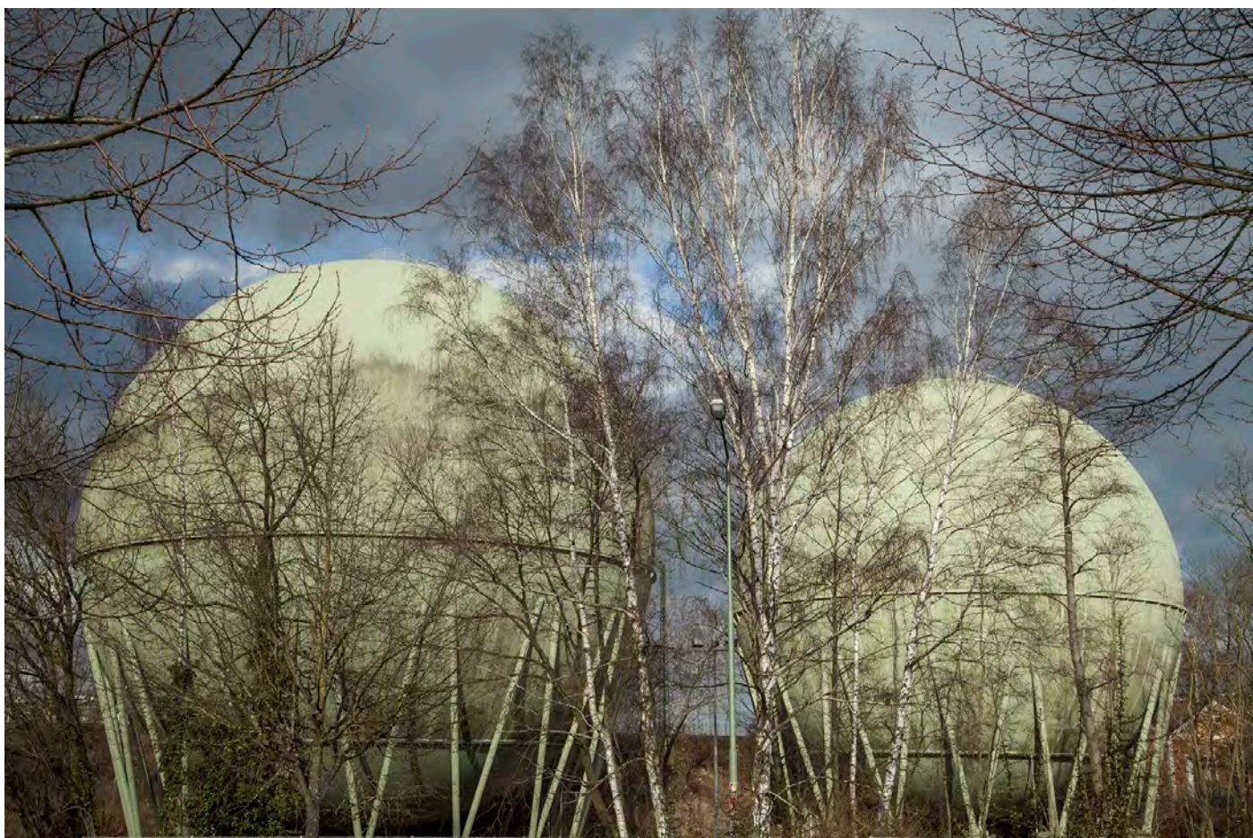
Aux Sources – Kaiserslautern, Allemagne, 2015-2018