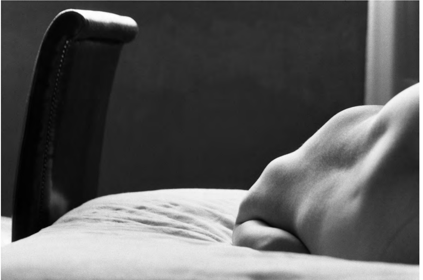
© Denis Roche 19 juillet 1986. Saragosse, Espagne, Hôtel Alfonso Rey I, chambre 215