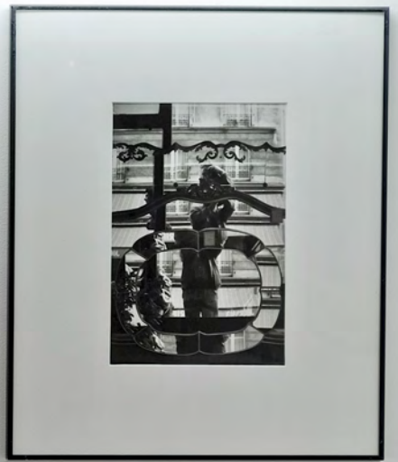
1940s-1950s Miami, Florida