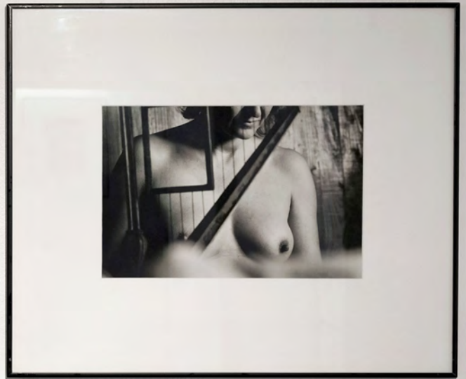
1941-1942 The Great Pyramid