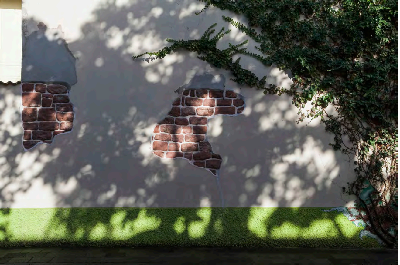
Aux Sources – Kaiserslautern, Allemagne, 2015-2018