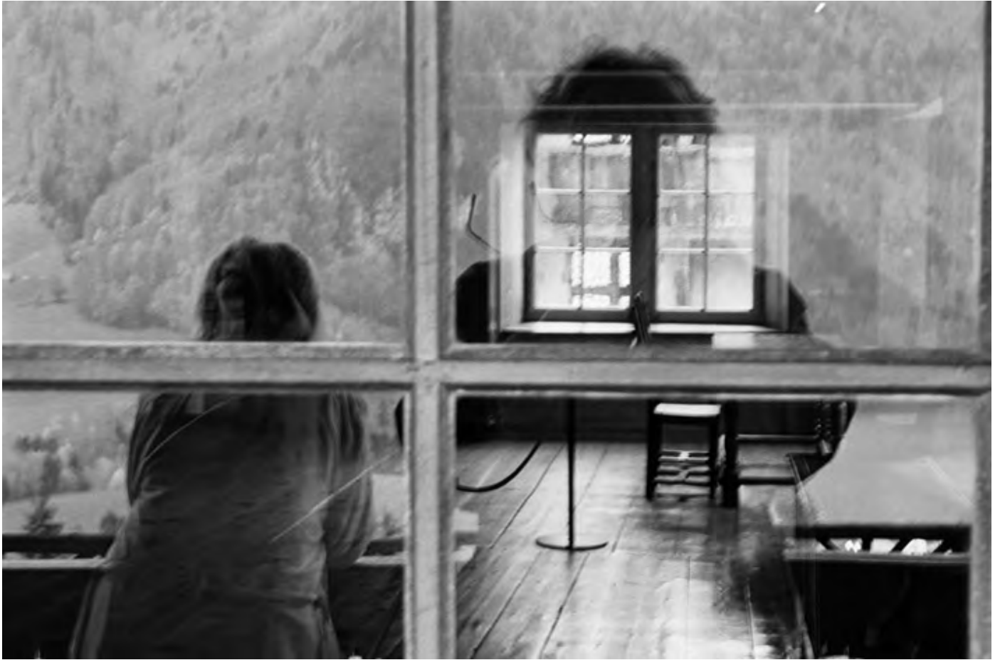
© Denis Roche 5 mai 1996. Gruyères, Suisse