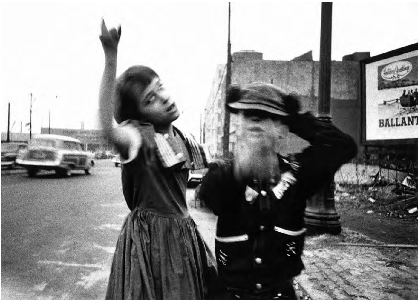
© William Klein Dance in Brooklyn, New York 1954