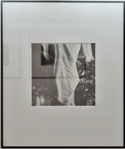
1940s-1950s New York, New York