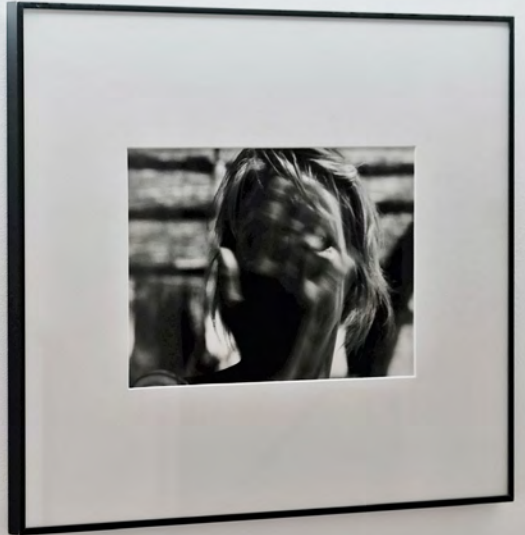
2 août 1981, Aix