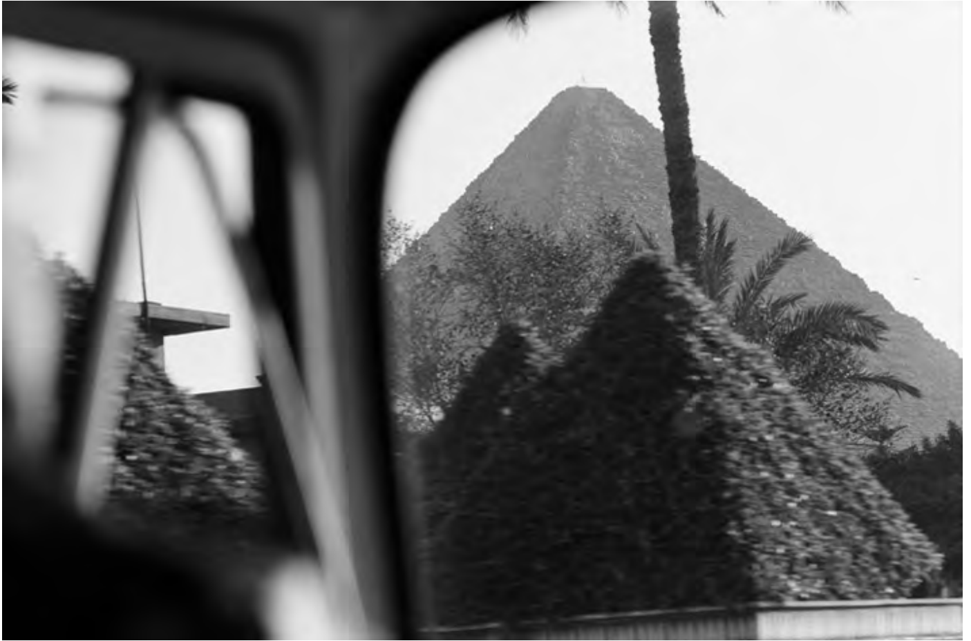
3 avril 1981. Vers Gizeh, Égypte