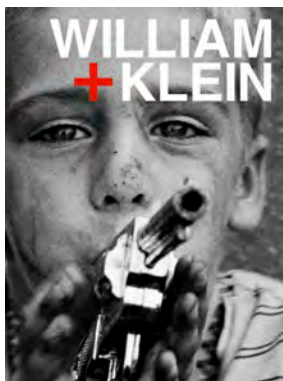
WILLIAM + KLEIN Textuel, 2018 39 €