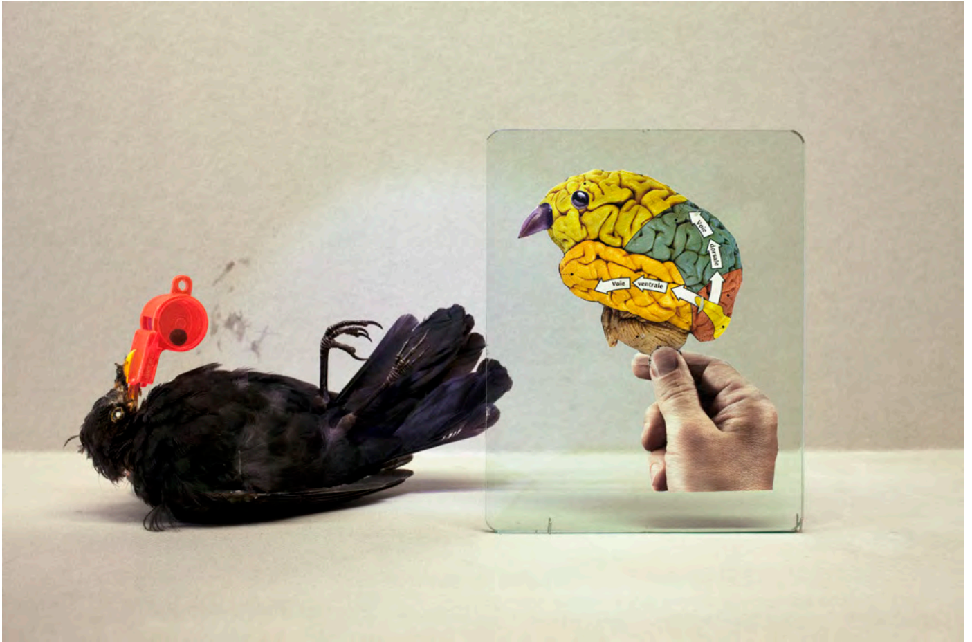
© Philippe Pétremant Blackbird , 2016