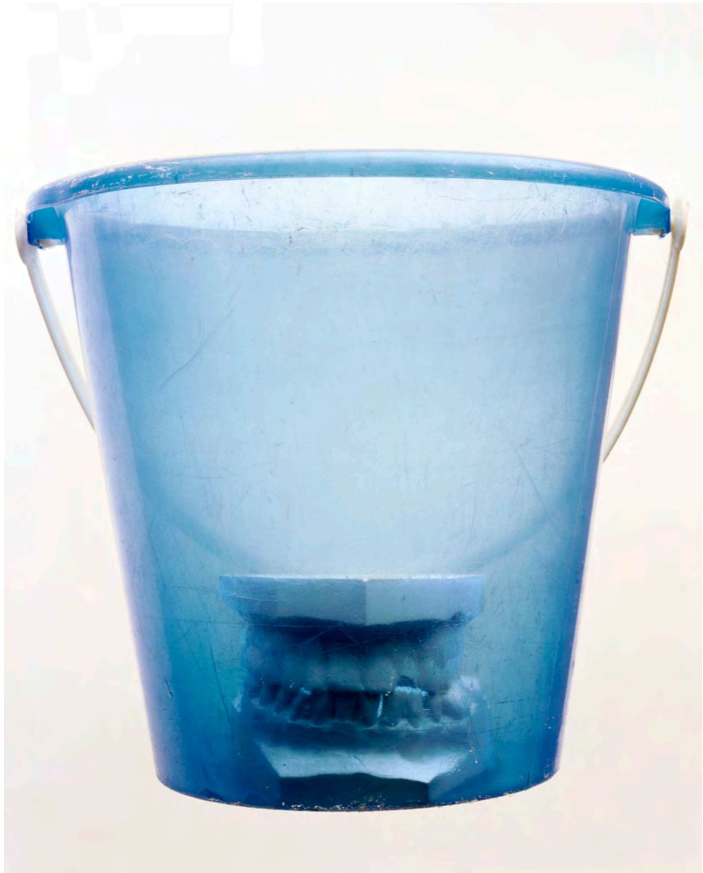
© Philippe Pétremant mais où est donc Ornicar, 2009