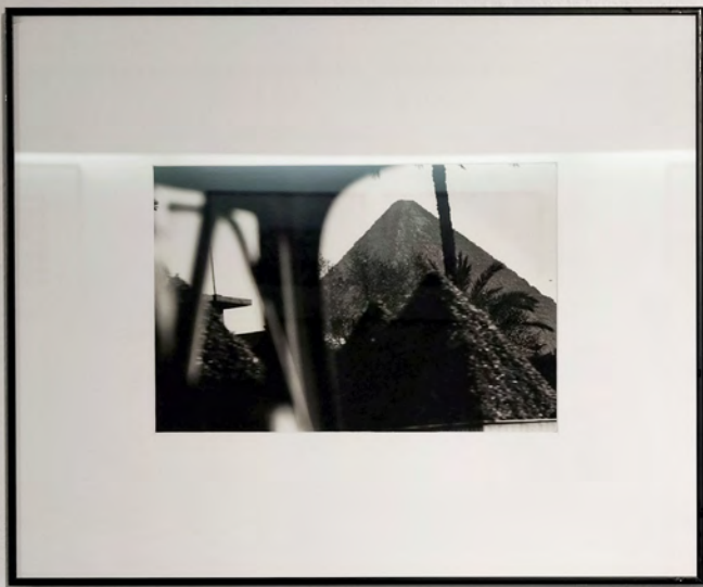
1941-1942 The Great Pyramid