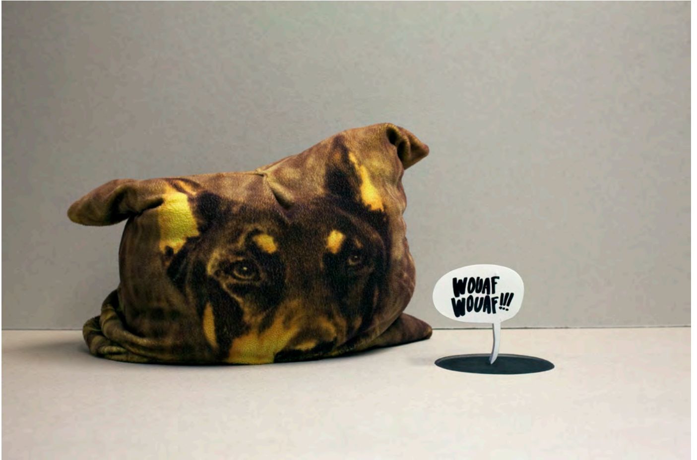
© Philippe Pétremant L'ombre et la proie , 2017