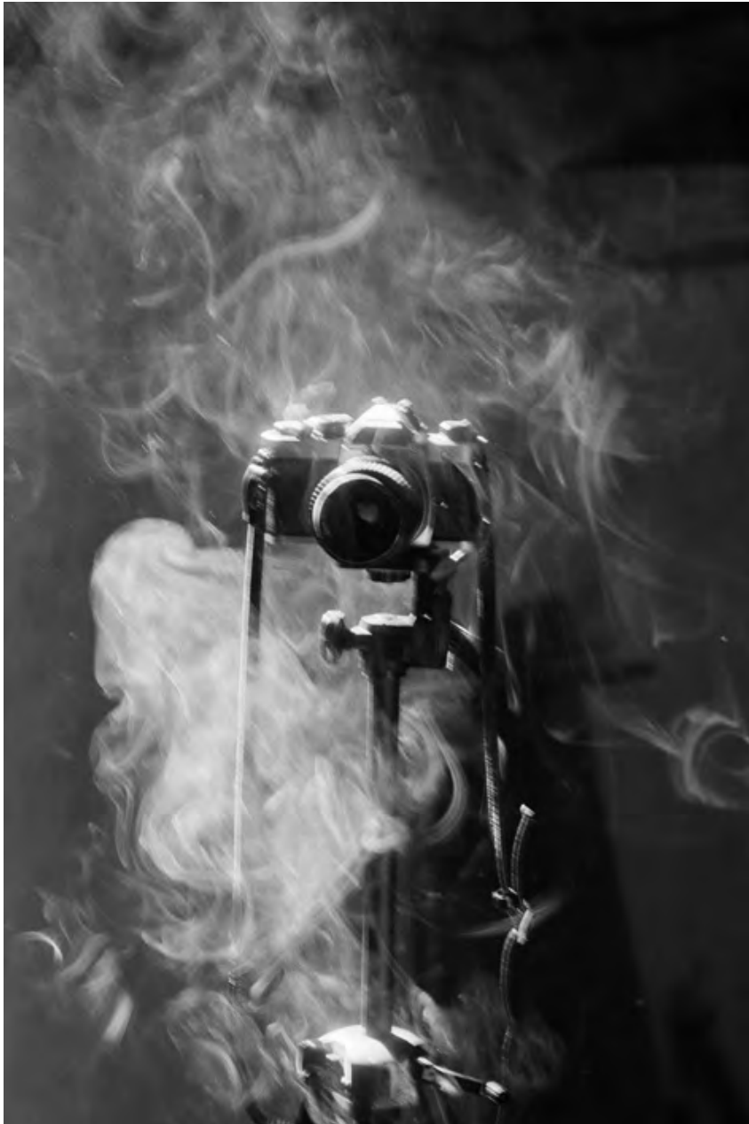
© Denis Roche 2 août 2000. Villiers