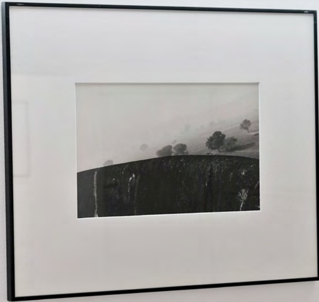
27 novembre 2015 Aix, Val de Bièvre