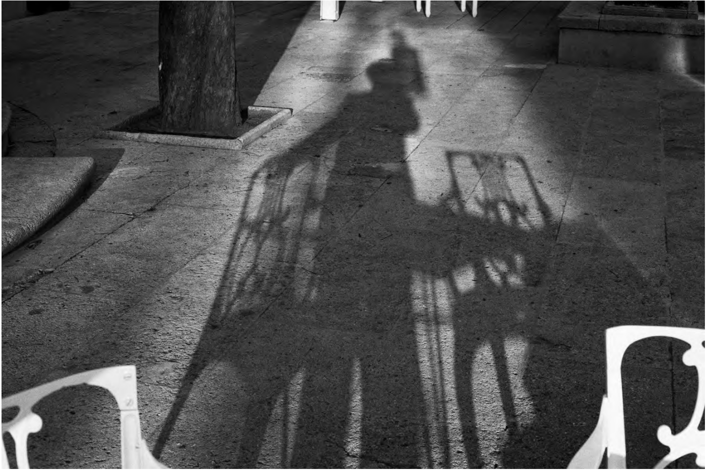
© Denis Roche 1er février 1989. Aix-en-Provence