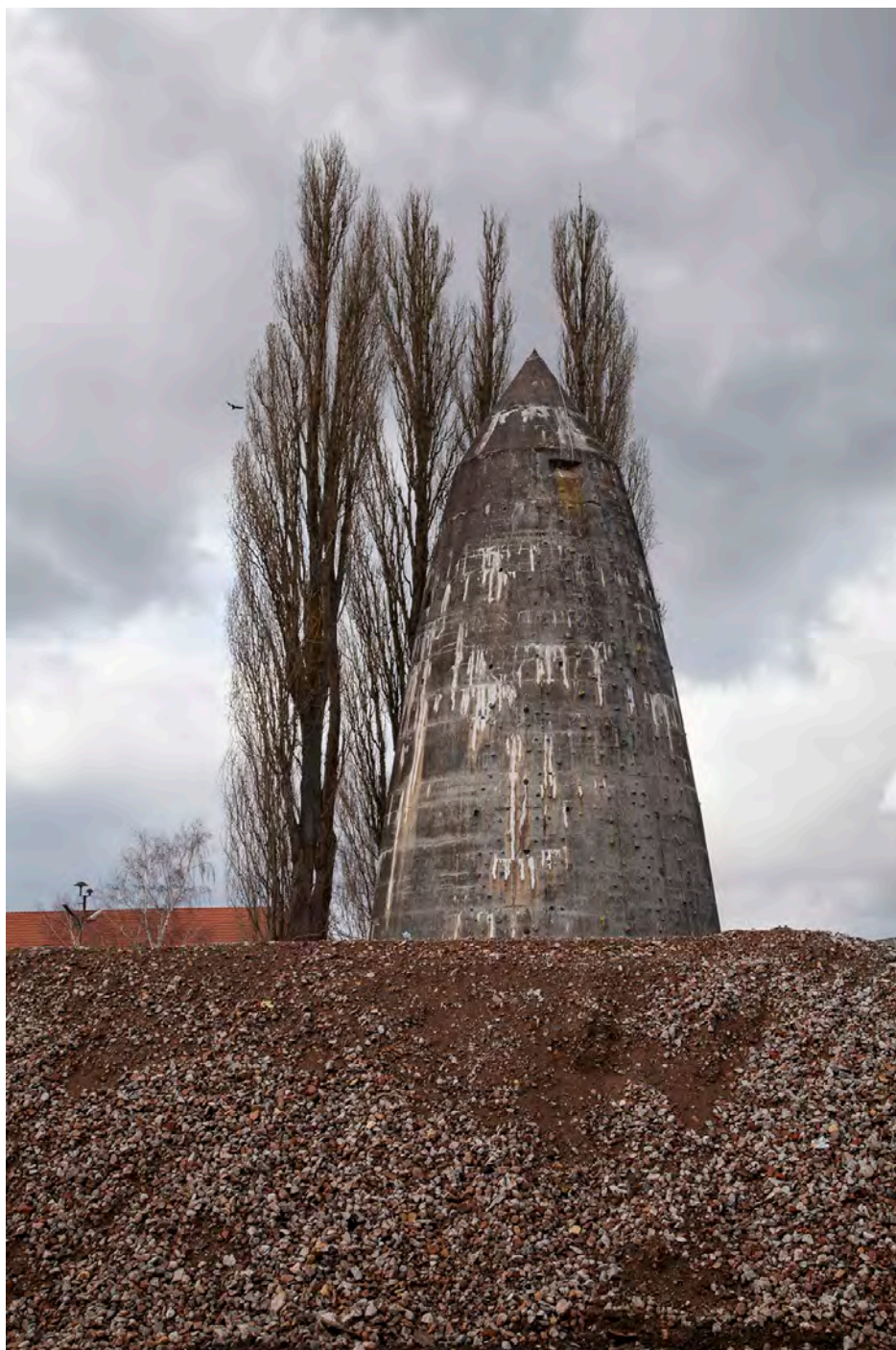
Aux Sources – Kaiserslautern, Allemagne, 2015-2018