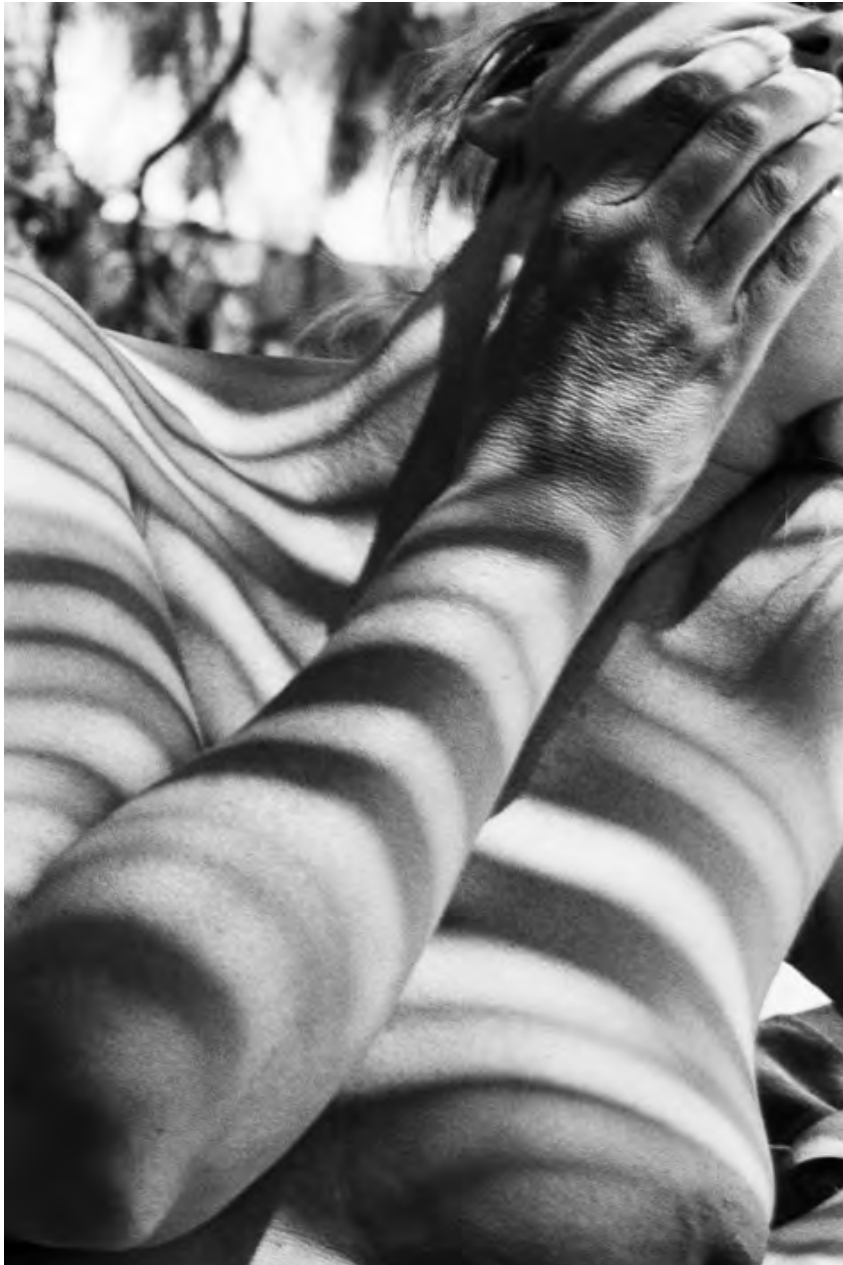
© Denis Roche 3 août 1993, Nice