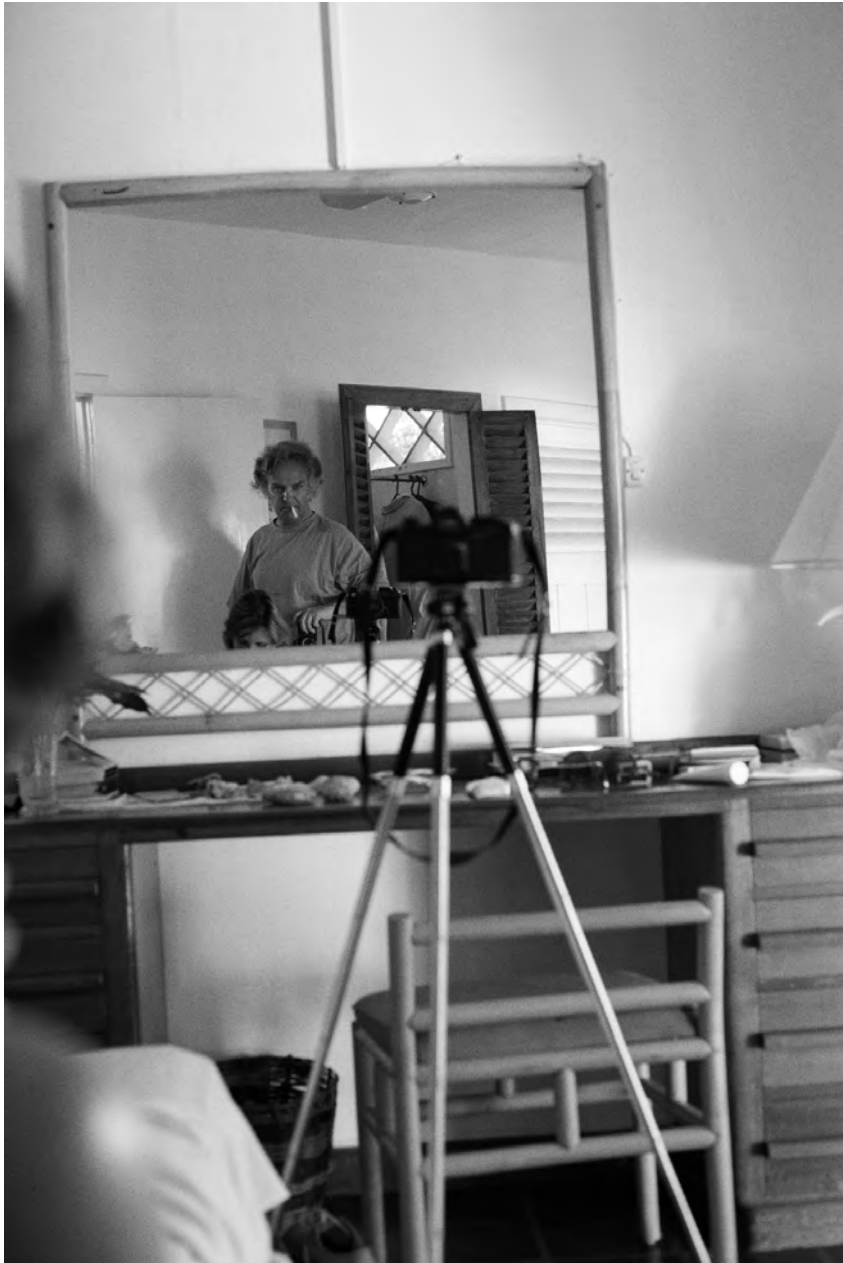
© Denis Roche 11 avril 1989. Tobago, Arnos Vale, chambre 6