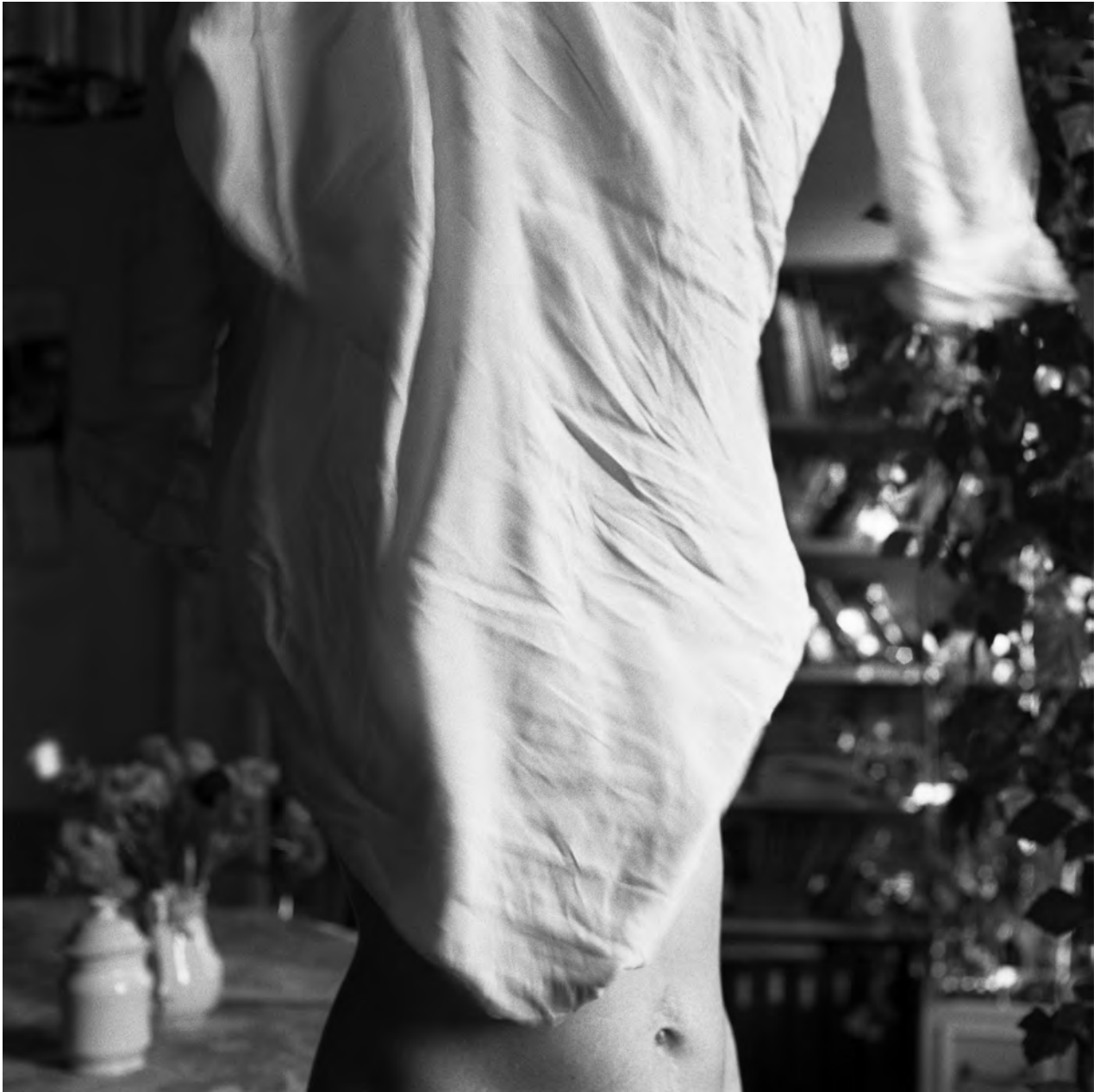
16 octobre 1976, Paris, rue Henri-Barbusse