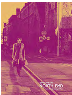
NORTH END Actes Sud, 2018 32 €