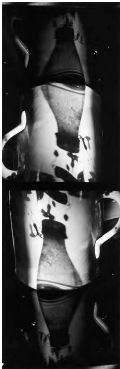
1 août 2004, Villiers - 2 contacts successifs