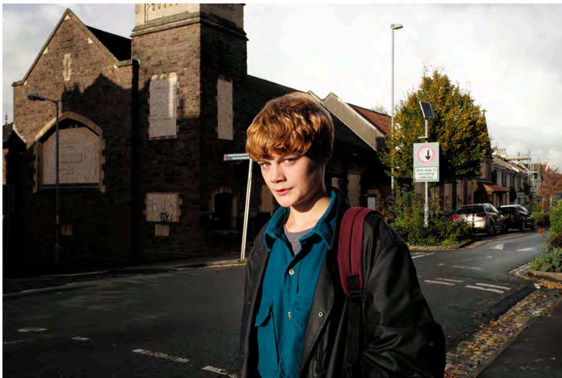
Série North End Bristol, 2015