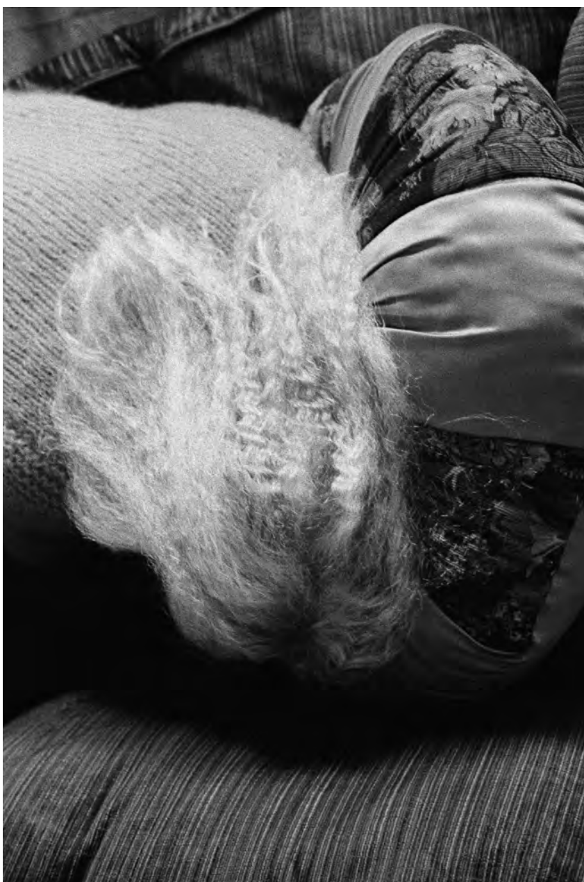
© Denis Roche 11 juin 1977, Paris, rue Henri -Barbusse