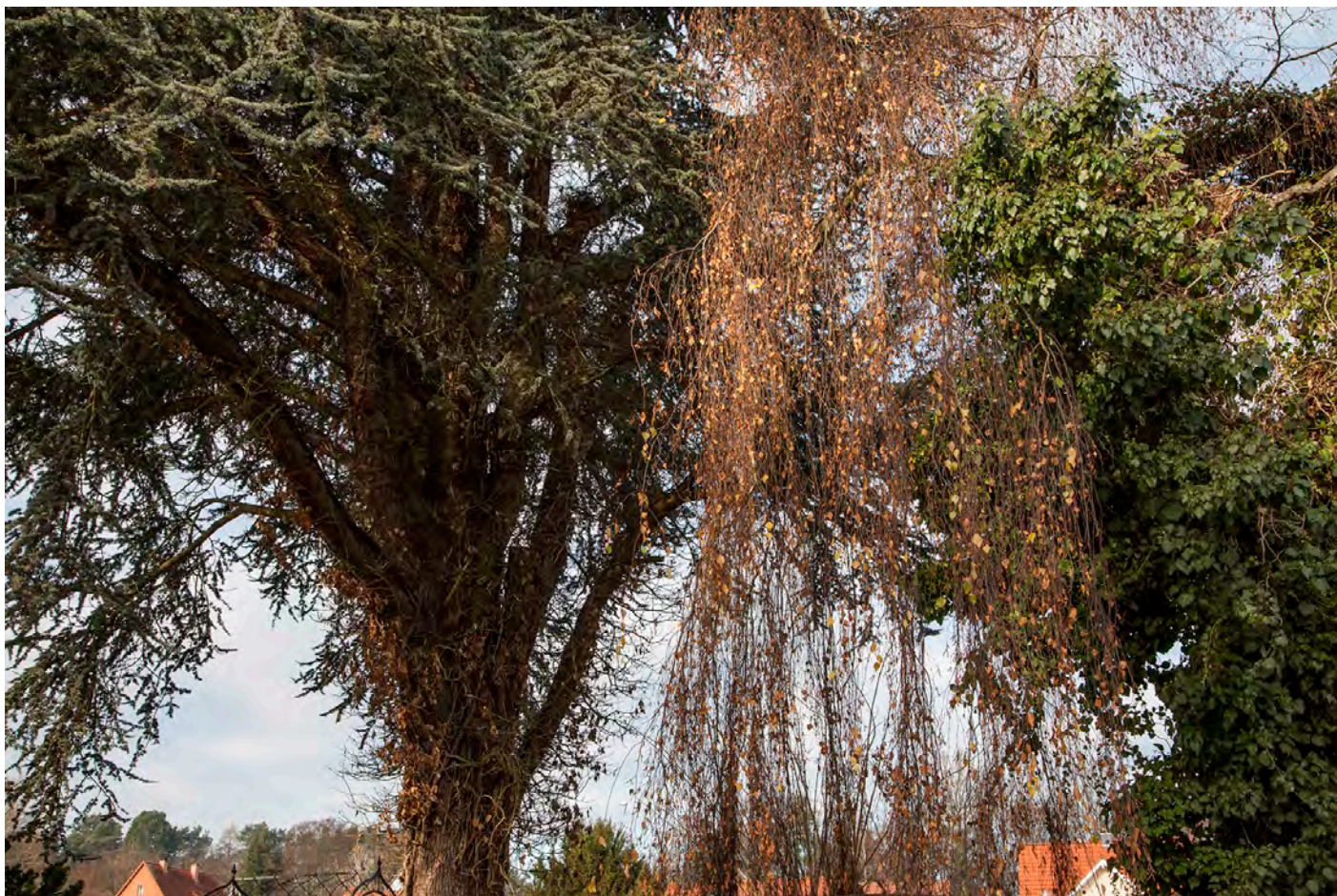
Aux Sources – Kaiserslautern, Allemagne, 2015-2018