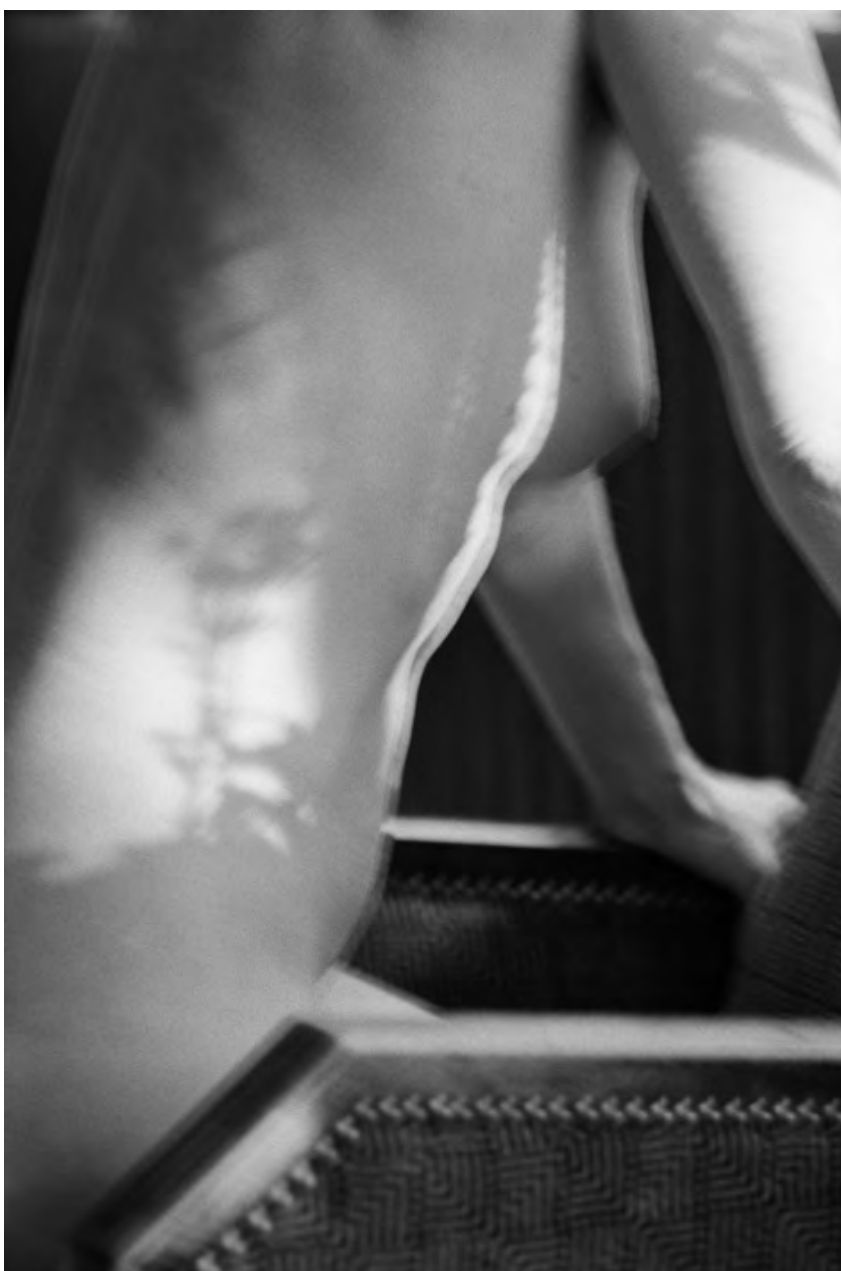
© Denis Roche 1 er juillet 1985. Paris