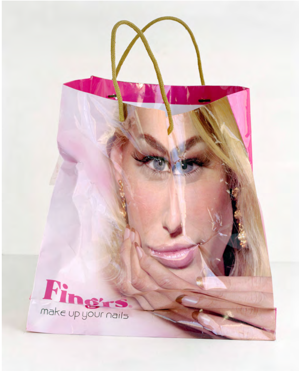
© Philippe Pétremant Paris Shopping , 2010