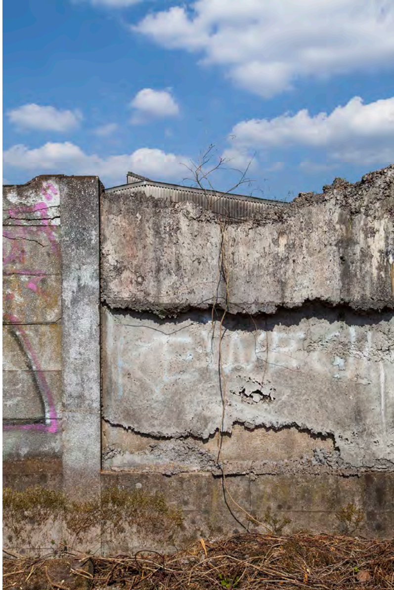
Aux Sources – Kaiserslautern, Allemagne, 2015-2018