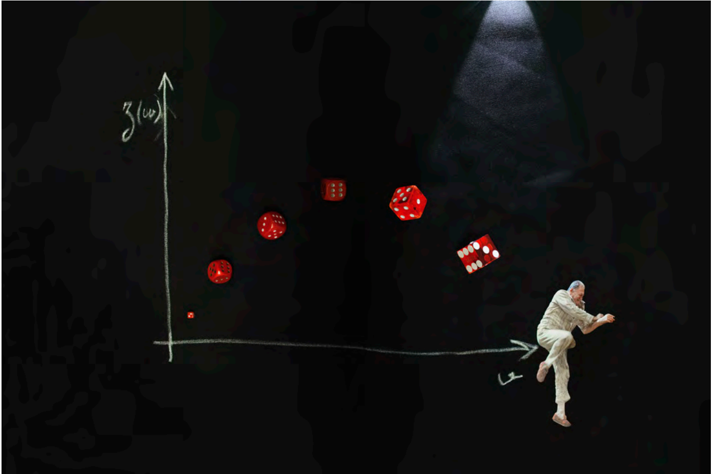
© Philippe Pétremant Matière et Déboires , 2017