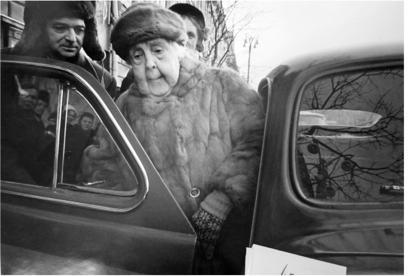
© William Klein Yoblonchikina, Sarah Bernhardt russe, Moscou, 1960