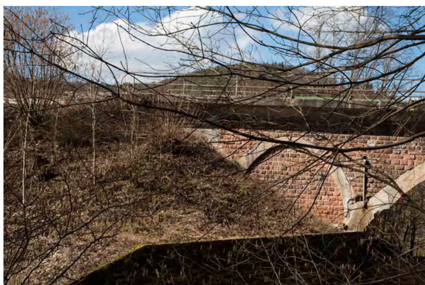
Aux Sources – Kaiserslautern, Allemagne, 2015-2018