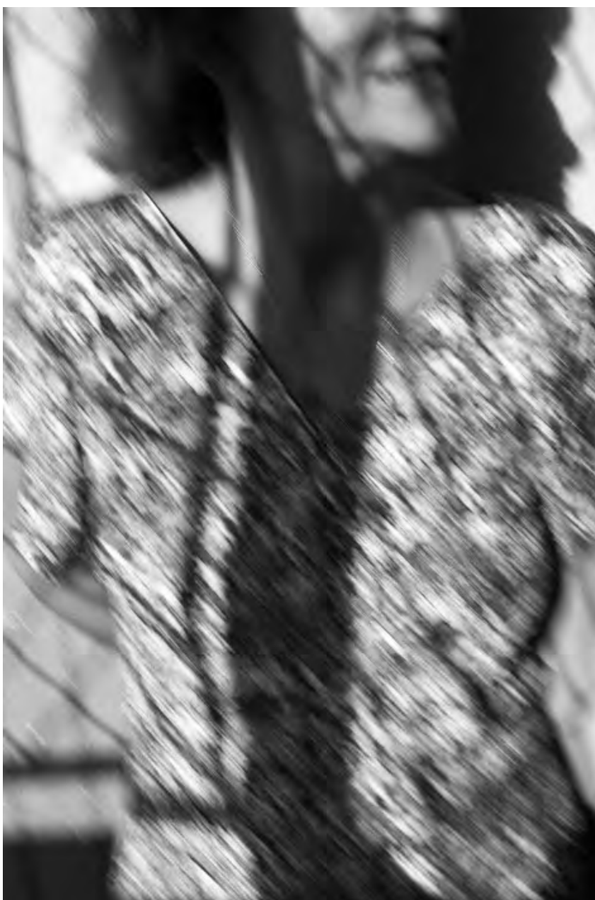
25 juin 1990, Lisbonne