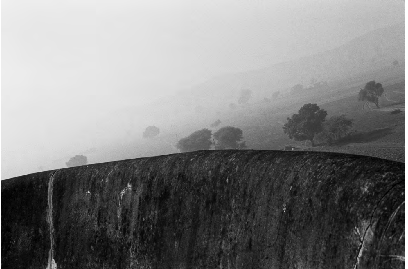
© Denis Roche 27 novembre 2010. Inde, Fort de Kesroli