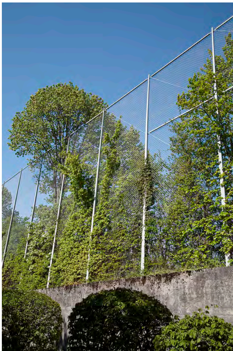
Aux Sources – Kaiserslautern, Allemagne, 2015-2018