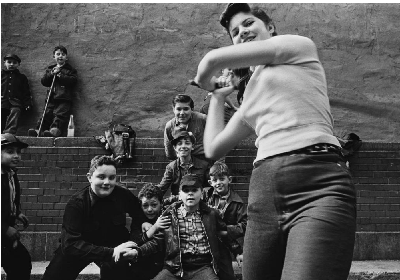
© William Klein Baseball de rue, 1955