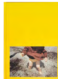
Impromptus Poursuite, 2017 20 €