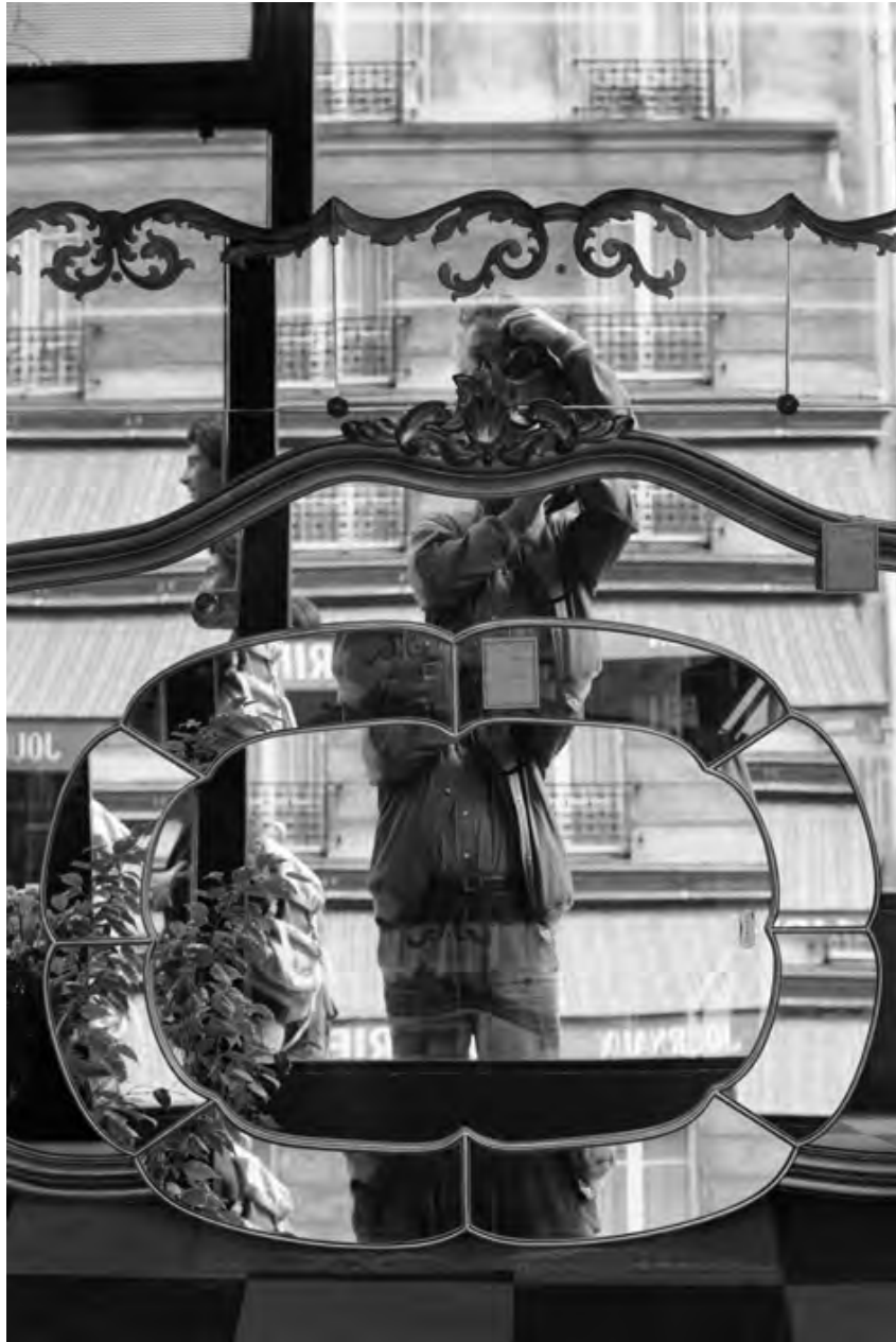
© Denis Roche 29 mai 1987, Paris