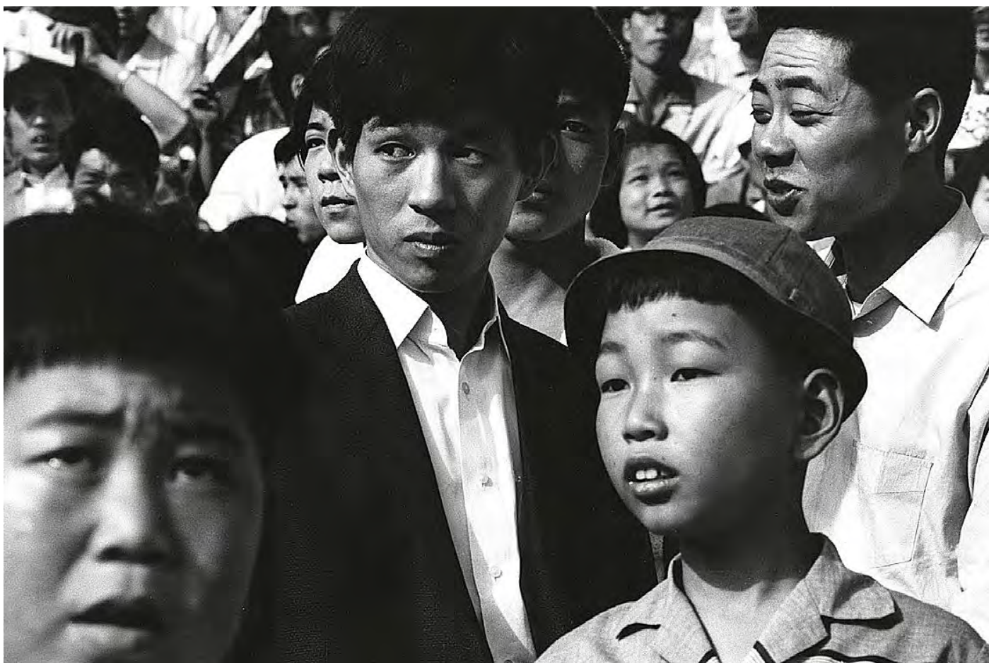
© William Klein Spectateurs, match de baseball, Tokyo 1961