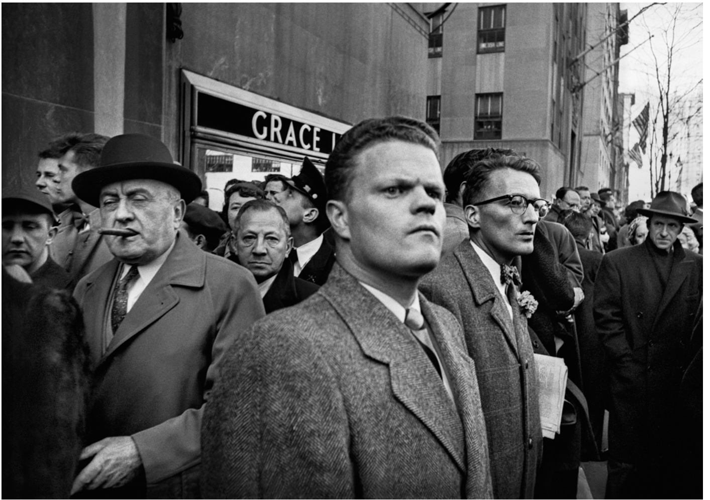
Grace Line, New York, 1955