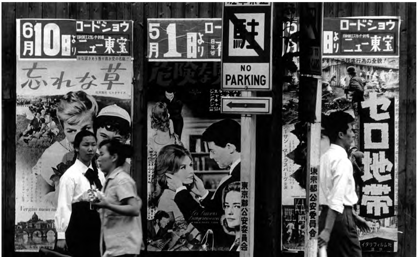
© William Klein Les liaisons dangereuses, Tokyo, 1961