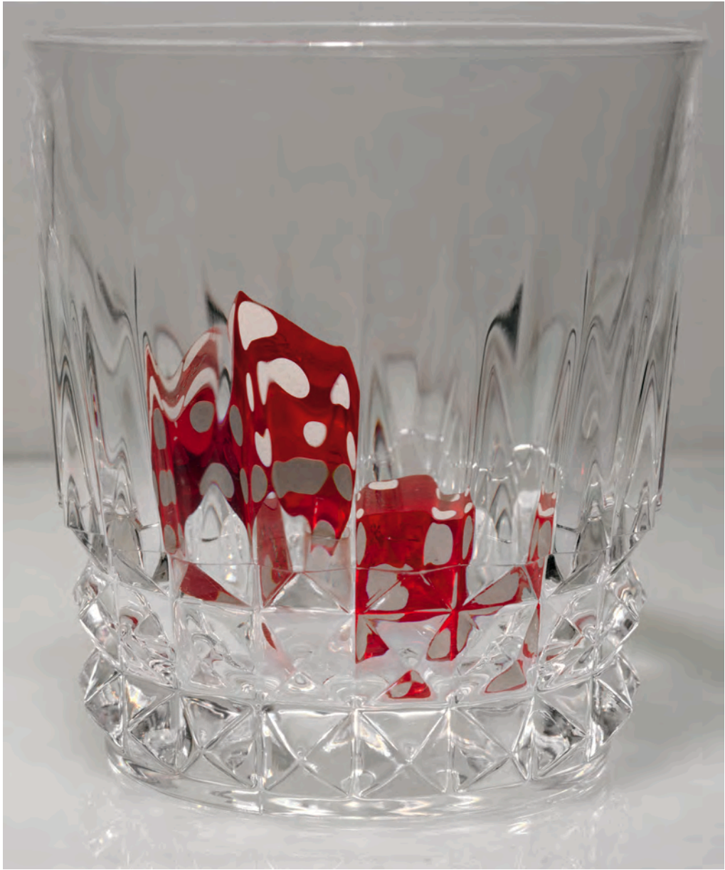
© Philippe Pétremant nu comme un vers , 2009