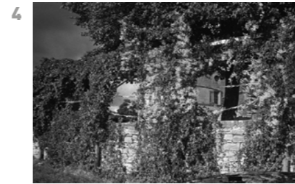
© Pierre de Fenoÿl, Tarn, France, 1987