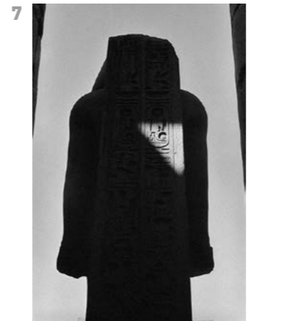
© Pierre de Fenoÿl Louxor, Haute Egypte, 1984