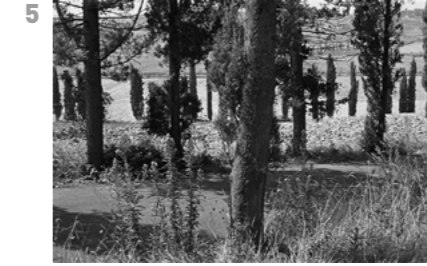
© Pierre de Fenoÿl, Toscane, Italie, 1981