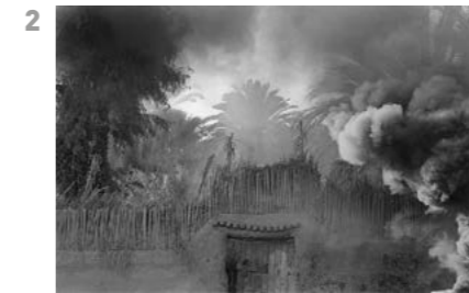
© Pierre de Fenoÿl, Egypte, 31 janvier 1981