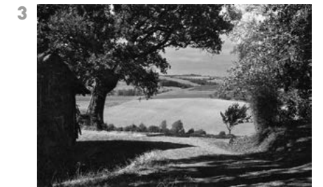
© Pierre de Fenoÿl, Tarn, France, 1985