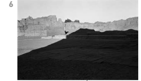
Haute-Egypte, 1981