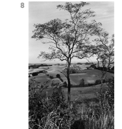
Languedoc, France, 1984