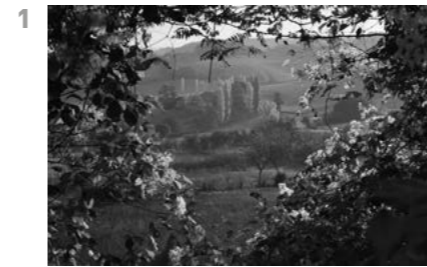
Castelnau de Montmiral, Tarn, 1985-1987, Datar

Les images sont utilisables et libres de droit pour la presse, dans le cadre de la seule promotion de l'exposition. L'affichage sur les sites Internet ne doit pas excéder 72 DPI.