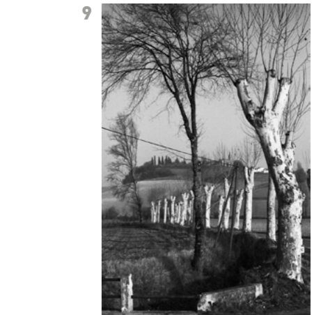
© Pierre de Fenoÿl Louxor, Haute Egypte, 1984