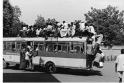
juin, 1968

Du 16 septembre au 30 décembre, la galerie Le Réverbère de Lyon accueille l'exposition Inde(s) au pluriel . Confrontant les regards de 8 photographes de renom, dont William Klein, Marc Riboud ou Bernard Plossu, l'exposition met en dialogue des clichés réalisés en Inde, des années 1960 à nos jours.