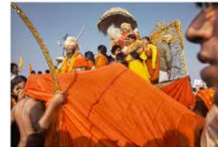
Pravara et Ghatkoti, Maharashtra, 2010

Enfin, Raghu Rai , photographe indien, est le seul artiste de cette sélection à photographier le pays en couleur, apportant une image plus dynamique de celui-ci.