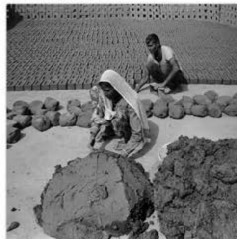
"Rajasthan" - 2016

Galerie Le Réverbère 38 rue Baudouin 69001 Lyon - 04 72 00 06 72 Du mercredi au samedi de 14h à 19h et sur rendez-vous en dehors de ces horaires.