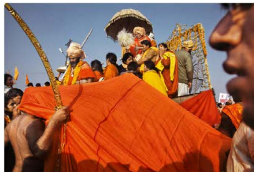
Raghu Rai / Magnum photos - Procession à Mahakumbh, Allahabad, 2011 © Coutesy Galerie Réverbère

La sélection de Lyon Capitale pour le mois de novembre