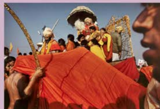
Inde(s) au pluriel - Exposition Collective