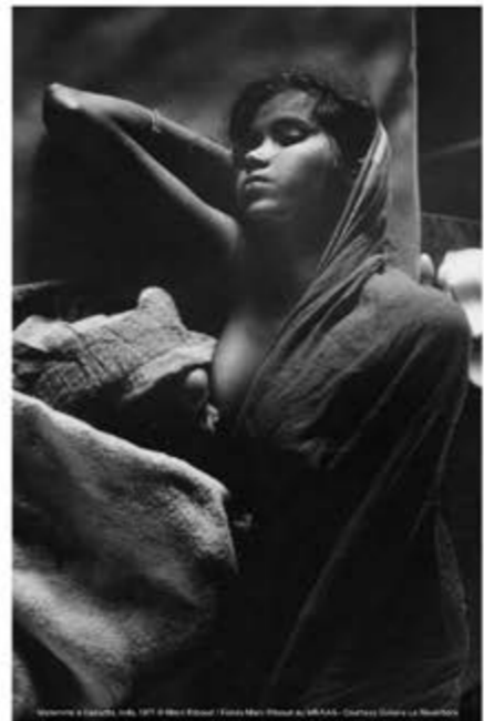
septembre à décembre, 1965, 1971

L'Inde a fasciné toute une génération. Pour cause, sa culture ancrée depuis des millénaires, ses villes sacrées, ses traditions si lointaines de la culture occidentale, et son image énigmatique . Dès la naissance de la photographie, l'Inde s'est présentée comme un des foyers de développement de cette nouvelle pratique. Les clichés de l'Inde se sont matérialisés, façonnant une image particulière au pays , qui a fini par inspirer et attirer de nombreux photographes occidentaux.