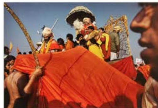
Procession at Mahabubli, Allahabad, 2001

Serge Clément, William Klein, Baudouin Lotin, Françoise Nalez, Bernard Plossu, Raghu Rai, Marc Riboud, Denis Roche