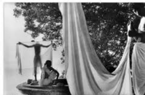
Le dhoni, Bénarès du Gange, Inde, 1966