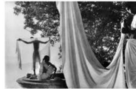
juillet, début de l'été, 1969

En effet, les clichés de William Klein et de Marc Riboud , réalisés entre les années 1960 et 1970 , donnent à voir le quotidien des Indiens en toute simplicité, à travers des photographes établies dans les rues, au sein de marchés, au bord du Gange ou dans les villes.