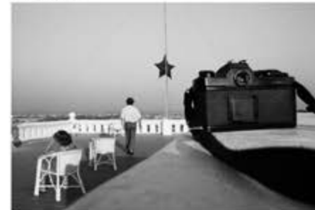
27 novembre 1968 - 1969