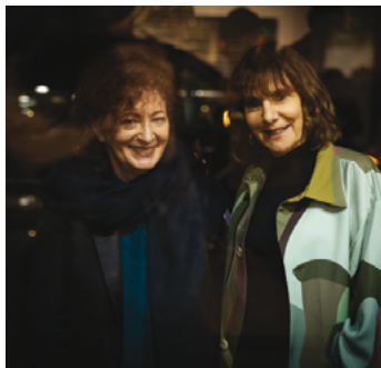
Nan Goldin et Bette Gordon