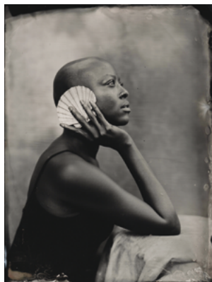
Aléas ©Laurence Papoutchian

3 e technique dans l'histoire de la photographie et sera utilisée par les artistes du XIX e siècle de 1851 à 1880. Laurence Papoutchian fait partie de ces photographes qui, par leur pratique nous donne à voir une photographie artisanale, où le geste, la lenteur et l'aléatoire permettent d'obtenir des images singulières et intemporelles. L'exposition Aléas regroupe différents travaux de l'artiste, présentant des natures mortes et des portraits réalisés sur verre et sur aluminium.