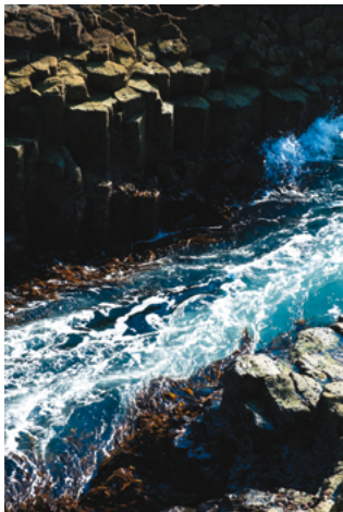
© Siouzie ALBIACH, Downpour , série An Old Tale , Ecosse, 2022

L'appel du Large met en avant la jeune création contemporaine avec les œuvres de dix artistes récemment diplômés des écoles des beaux-arts et de design de la région Auvergne- Rhône-Alpes, tous résidents